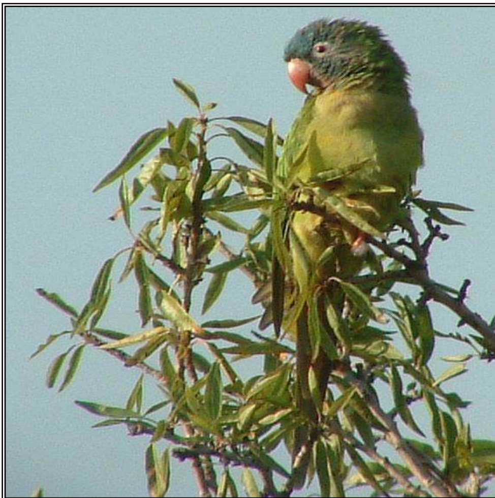
Aratinga de cap blau ( Aratinga acuticaudata ) a Tallades, Santa Cristina d'Aro, 11.IX.07. © Carlos Alvarez Cros.

Carlos Alvarez Cros (Comitè Avifaunístic Empordanès)