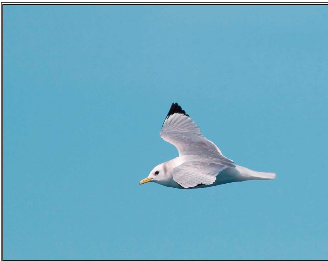
Gavineta de tres dits ( Rissa tridactyla ). PNCC, 13/03/2009