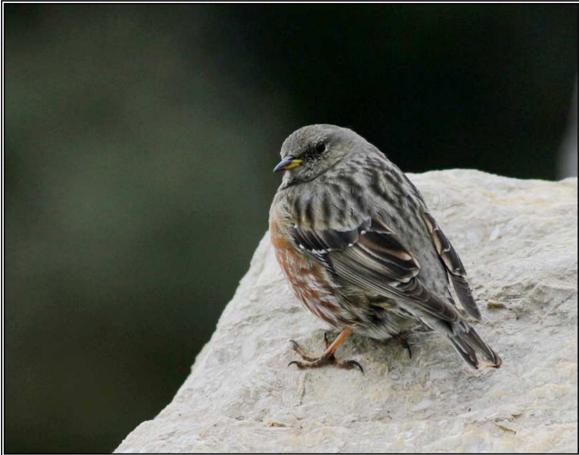
Cercavores ( Prunella collaris ), El Mont, 09.III.2011