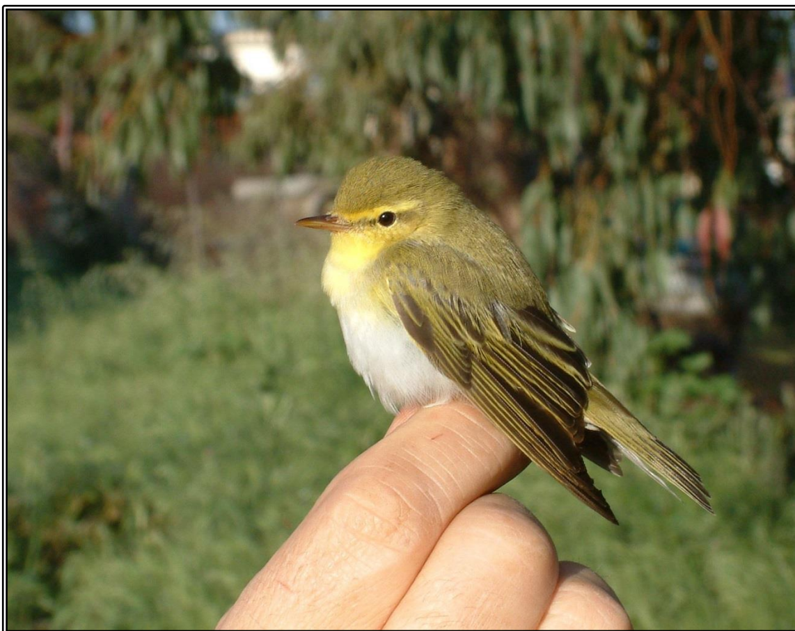
Mosquiter xiulaire ( Phylloscopus sibilatrix )