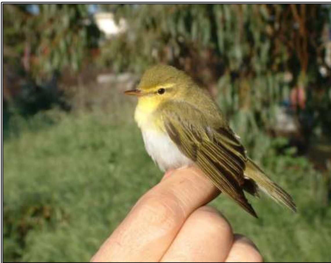
Mosquiter xiulaire ( Phylloscopus sibilatrix )