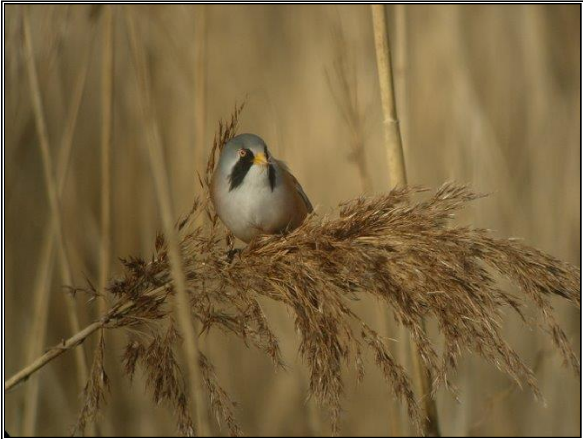
Mallerenga de bigotis ( Panurus biarmicus )

Marc Bertran Fabregas / Carlos Alvarez-Cros