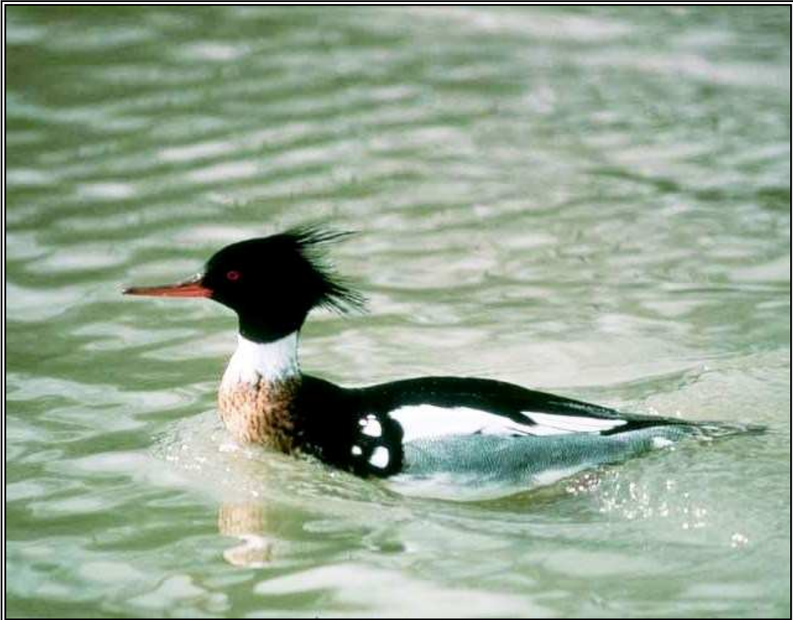
Bec de serra mitjà mascle ( Mergus serrator ) .