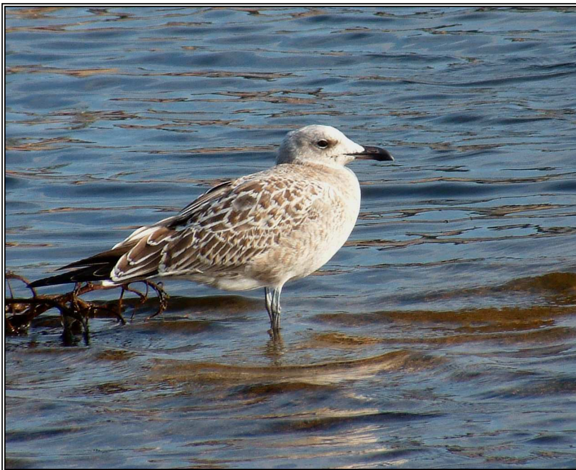
Gavina corsa ( Larus audouinii). Desembocadura del Ridaura, Castell-Platja d'Aro, 11/08/05.