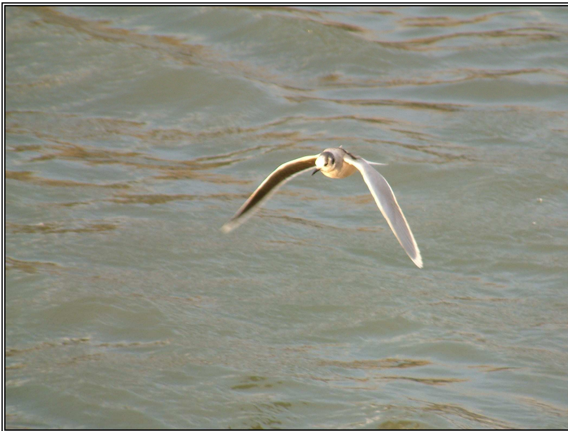
Gavina menuda ( Hydrocoloeus minutus ), 08/01/06, Castell-Platja d'Aro