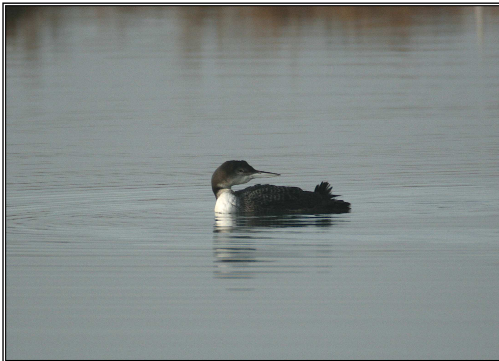
Calàbria grossa ( Gavia immer ) al Grau de Sta. Margarida, Roses.

Citació recomanada: Ollé, A.. 2009. Recull de citacions de calàbria grossa ( Gvia immer ) a l'Empordà. Comitè Avifaunístic Empordanès.