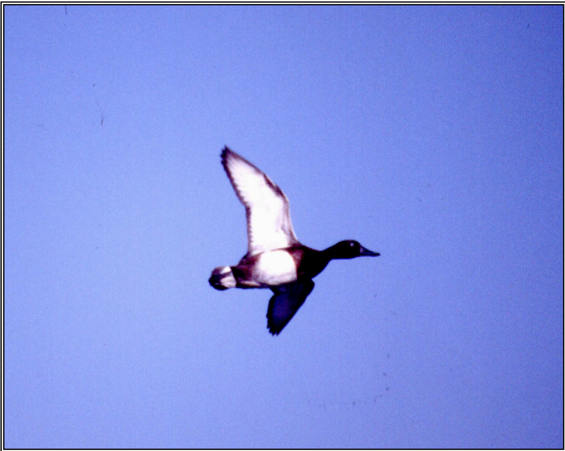
Masclé de morell xocolater ( Aythya nyroca ), a Vilaüt, el 22.III.1986.