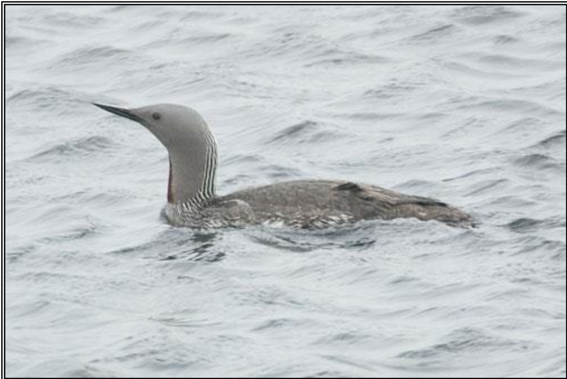
Calàbria petita ( Gavia stellata )