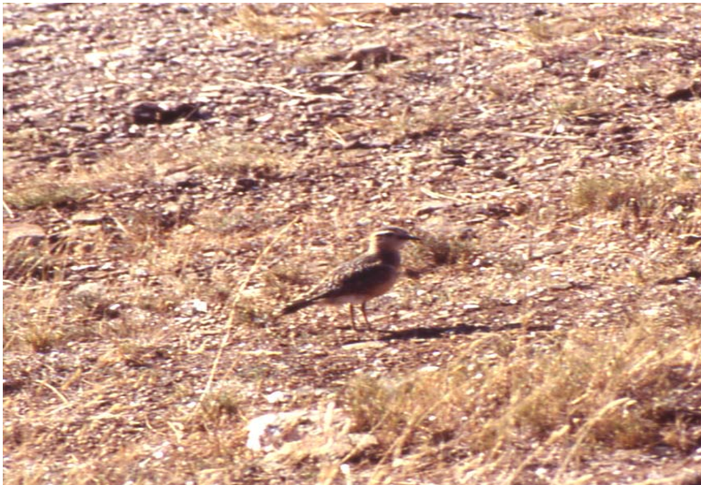
Corriol pit-roig (Puig d'Esquers). Maria José Larios