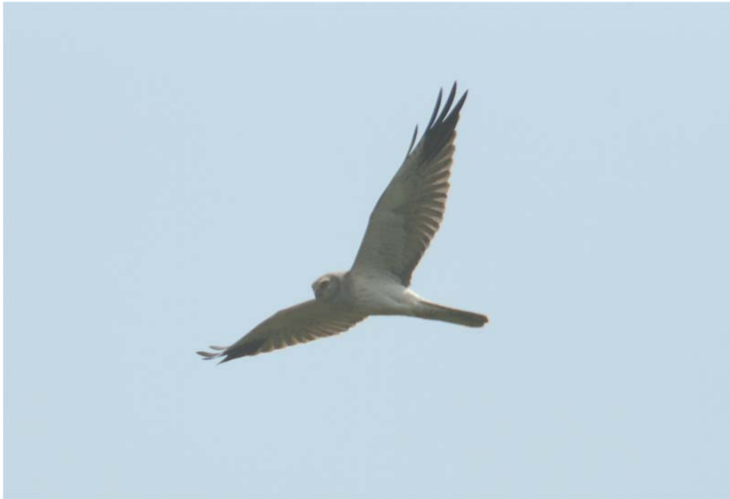
Arpella pàl-lida russa (Mollet de Peralada). Àlex Ollé