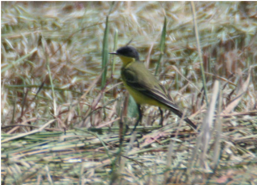
Cuereta groga balcànica (Mollet de Peralada). Àlex Ollé

Capmany 1 parella + 2 polls volanders el 17-VII. (Marc Puig)