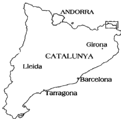
Situació de l'Albera en relació a Catalunya.