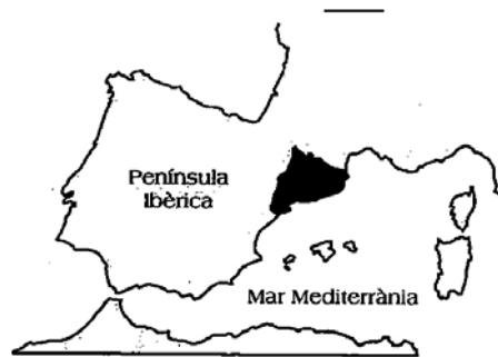
Situació dins la península Ibèrica.