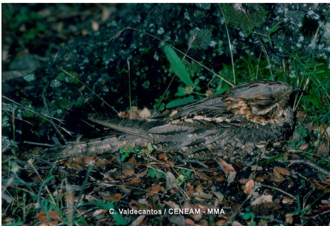
Siboc ( Caprimulgus ruficollis )