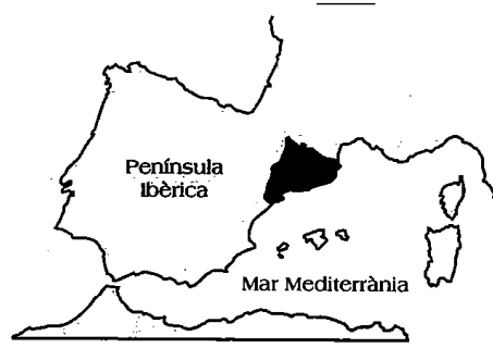
Situació dins la península Ibèrica.